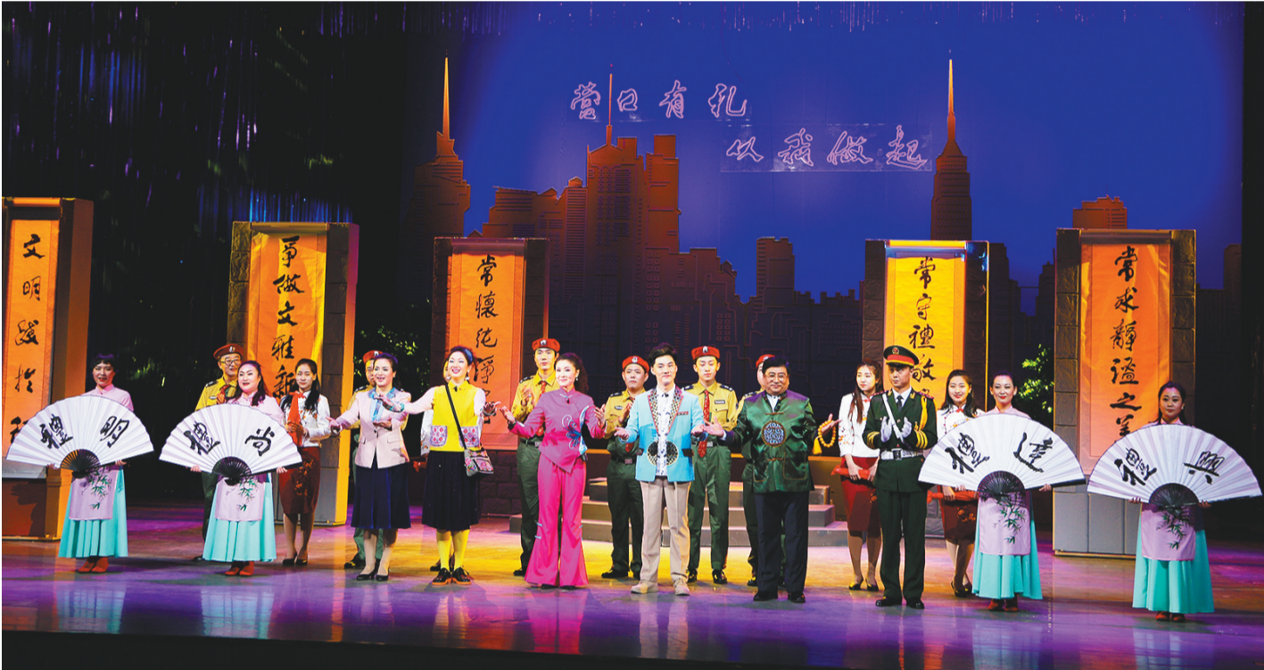
现代辽剧《礼之恋》演出剧照。

辽剧是我省唯一的地方剧 种，盖州是辽剧的发源地， 并长期承担辽剧传承发展 的重任。从数十年悲壮坚 守、潜心做艺，到在各级 政府支持下开创发展新篇， 深植于盖州的辽剧践行 “用明德引领风尚”，依 靠贴近时代、贴近百姓的 主题创作引发全城共鸣， 并发力走向全国。