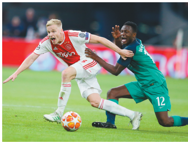
左图:从大巴黎弃将到热刺队英雄,5月9日,卢卡斯·莫拉用3粒进球把热刺队送进了欧冠决赛。右图:这是一场鏖战,热刺队的胜利来自全队的不放弃。图为热刺队球员万尼亚马(右)在比赛中与阿贾克斯队球员范德贝克拼抢。