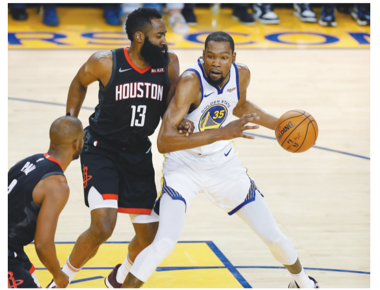
杜兰特(右)意外受伤下场,成为这场比赛的转折点。

列赛,勇士队生生把杜兰特用成了詹姆斯。连主教练科尔也瞻前顾后起来,原来勇士队最引以为傲的就是轮换阵容超强,主力队员可以有大把的休息时间,最后关头再上场收割比赛胜利也不迟。可现在,科尔不但早早使用“死亡五小”作为首发阵容,在队员轮换方面也变得令人不解。事实证明,勇士队的替补席上,仍然有可堪大用的球员,最后一节,替补中锋卢尼撑起了勇士队的内线,他多次在关键时刻抢到前场篮板,在最后时刻,卢尼不仅封盖了保罗的上篮,又精准找到篮下的汤普森,送出助攻杀死比赛。与此同时,库里也开始苏醒,杜兰特受伤之前,库里14中4,杜兰特下场之后,库里在最后14分钟里9投5中,独得16分2助攻。勇士队之所以成为勇士队,是因为能打出团队篮球,这场比赛就是最好的提醒。