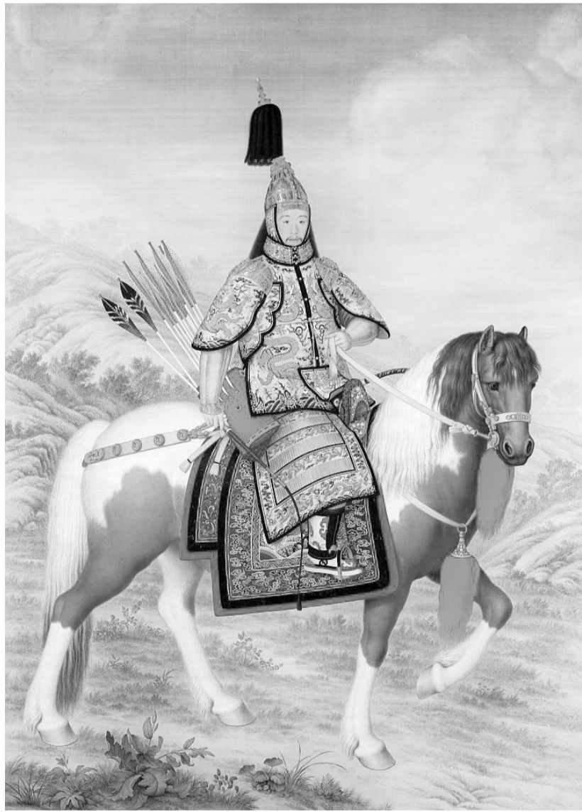
《乾隆大阅图》(现藏于北京故宫)