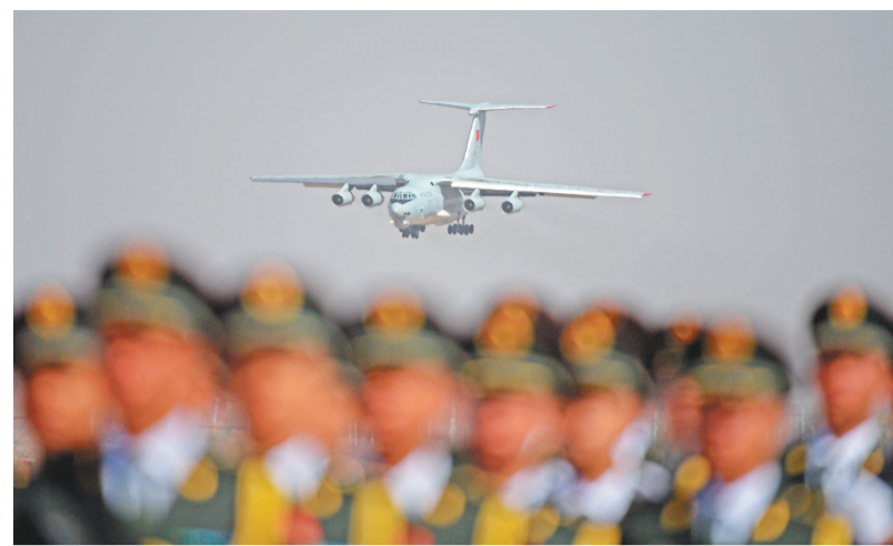
4月3日,第六批在韩中国人民志愿军烈士遗骸由我空军专机护送从韩国接回辽宁沈阳,运送志愿军烈士遗骸的空军专机准备降落沈阳桃仙国际机场。