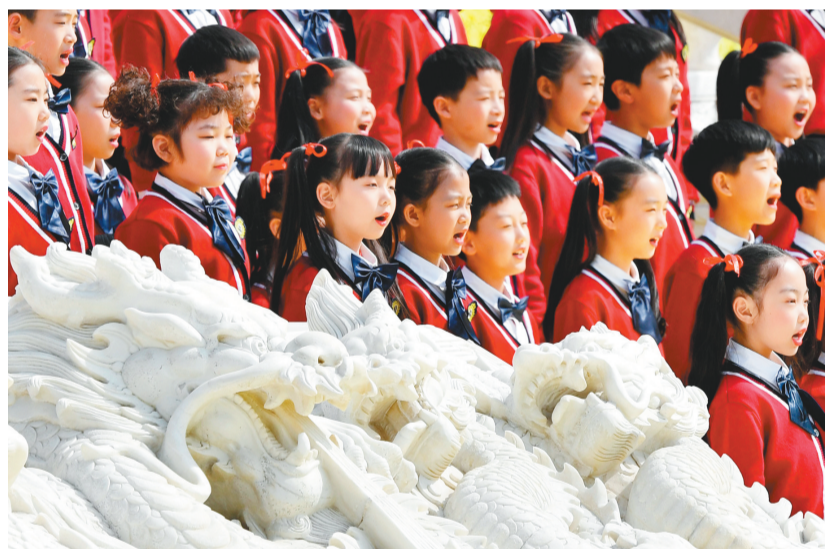
本组图为4月7日,演员在己亥年黄帝故里拜祖大典上表演。