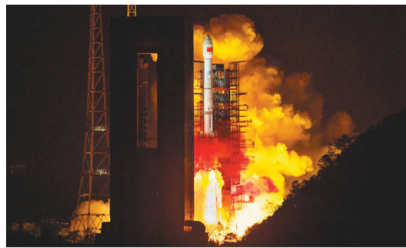
3月31日23时51分,我国在西昌卫星发射中心用长征三号乙运载火箭,将天链二号01星送入太空,卫星成功进入地球同步轨道。