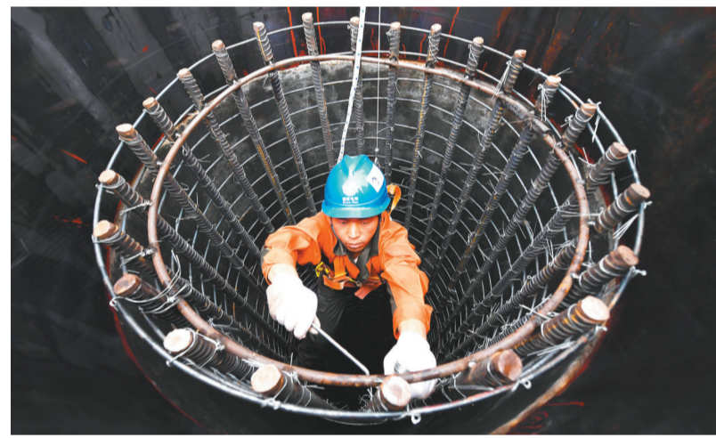
3月29日,青海—河南±800千伏特高压直流工程跨秦岭段施工现场,工作人员在进行首基铁塔基础钢筋绑扎。