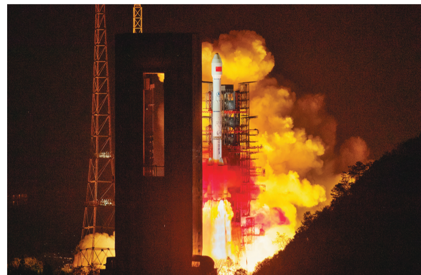
3月31日23时51分,我国在西昌卫星发射中心用长征三号乙运载火箭,将天链二号01星送入太空,卫星成功进入地球同步轨道。

据新华社西昌4月1日电(李国利 钱铃奇) 3月31日23时51分,我国在西昌卫星发射中心用长征三号乙运载火箭,将天链二号01星送入太空,卫星成功进入地球同步轨道。