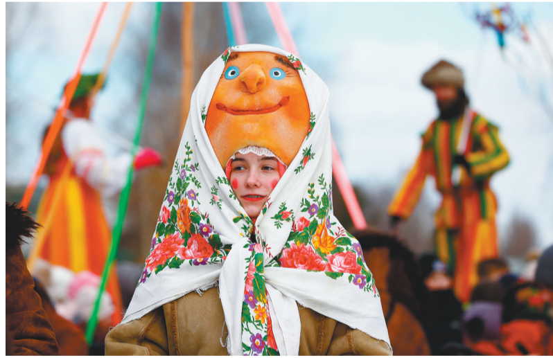
3月2日,在白俄罗斯阿齐亚科村,人们参加“谢肉节”庆祝活动。“谢肉节”,也称“送冬节”。按照习俗,人们会在节日期间举行盛装表演、品尝薄饼、焚烧稻草人、滑雪橇等活动,希望借此告别寒冷漫长的冬季,迎来明媚的春天。