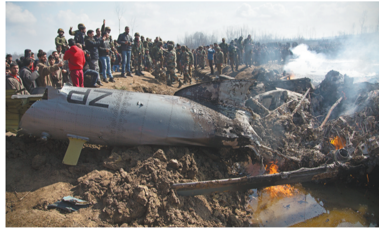
2月27日,在印控克什米尔地区夏季首府斯利那加附近,人们聚集在战机残骸旁。巴基斯坦新闻局2月27日说,巴空军当天清晨在巴基斯坦领空击落两架通过克什米尔印巴实际控制线侵入的印度空军战机。