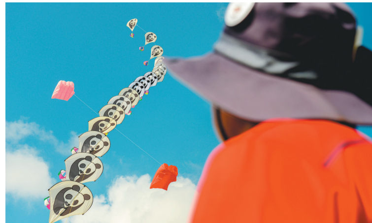
3月1日,在马来西亚南部柔佛州的巴西古当,风筝手在放风筝。马来西亚第24届巴西古当国际风筝节3月1日开幕。本届风筝节的主题是“文化之美”,共有来自中国、日本、德国、法国、美国和马来西亚等国家和地区的风筝爱好者参加。