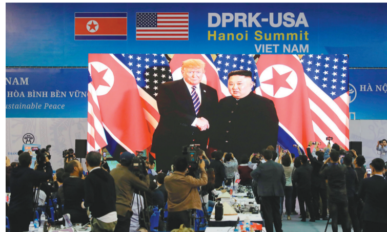
2月27日,在越南首都河内,记者在国际媒体中心观看和拍摄朝鲜最高领导人金正恩(屏幕右侧)与美国总统特朗普会面的电视直播。朝鲜最高领导人金正恩与美国总统特朗普2月27日傍晚在越南首都河内会面,拉开朝美领导人第二次会晤序幕。