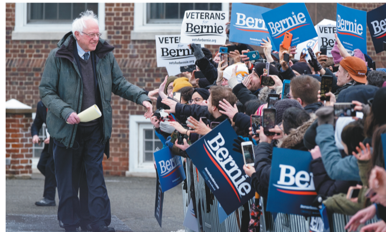
3月2日,在美国纽约,美国联邦参议员伯尼·桑德斯参加总统竞选集会。当日,伯尼·桑德斯在纽约举行首场总统竞选集会。