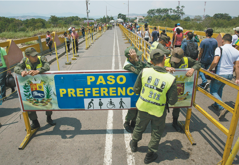
2月22日,在委内瑞拉塔奇拉州,军人把守委与哥伦比亚边界的西蒙·玻利瓦尔国际大桥。

据新华社加拉加斯2月22日电 委内瑞拉副总统罗德里格斯22日晚宣布,暂时关闭委与哥伦比亚边界的西蒙·玻利瓦尔国际大桥、桑坦德大桥和联合大桥。