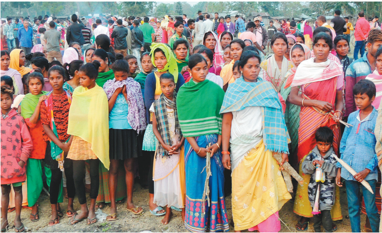
2月22日,在印度阿萨姆邦,人们聚集在假酒事件受害者的遗体旁。印度阿萨姆邦卫生部门23日证实,该假酒事件造成的死亡人数已上升至80人。其中,戈拉卡德县医院报告死亡45人,邻近的焦尔哈德县医院报告死亡35人。