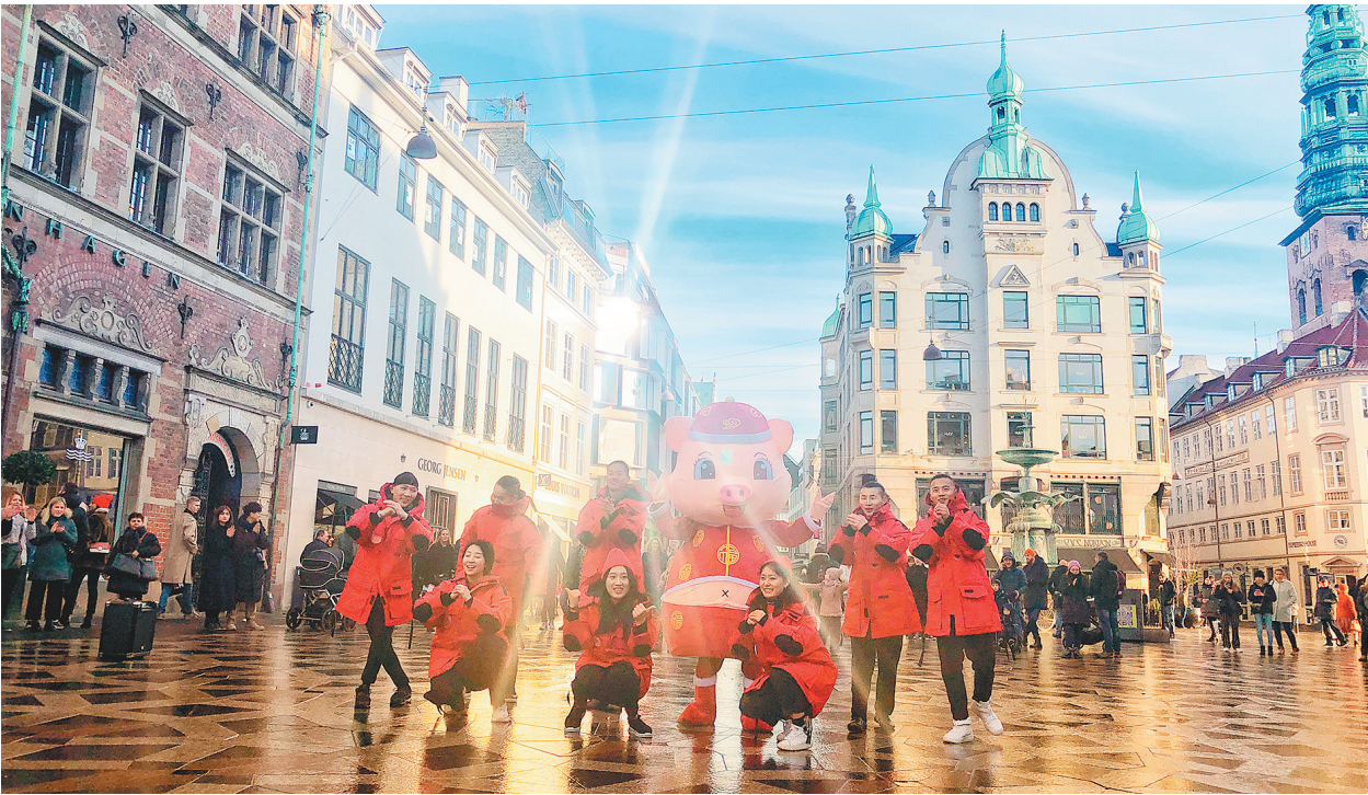
图为今年1月19日,由哥本哈根中国文化中心与北京市文化和旅游局联合主办的“欢乐春节”系列活动之一“金猪闹新春”快闪表演亮相丹麦首都哥本哈根(资料照片)。

西班牙旅游研究机构“前进指南”从2019年前4个月的旅游预订量情况分析,中国游客赴世界各地旅游预订量与2017年底相比增长9.3%,而赴欧预订量增长了16.9%,其中,春节期间中国赴欧盟国家旅游的预订量同比增长9.2%。