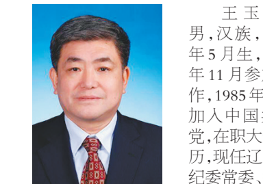
王玉珠，男，汉族，1961年5月生，1980年11月参加工作，1985年8月加入中国共产党，在职研究生学历，现任辽宁省纪委监委委员，兼任辽宁省委巡视组组长。