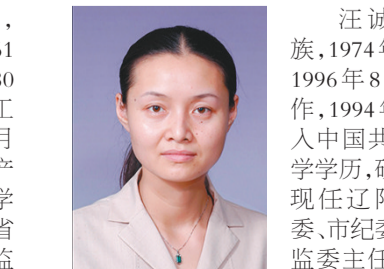
汪诚，女，汉族，1974年9月生，1996年8月参加工作，1994年10月加入中国共产党，大学学历，硕士学位，现任辽宁省委常委、市纪委书记、市监委主任，兼任辽宁省委巡视工作领导小组办公室主任。