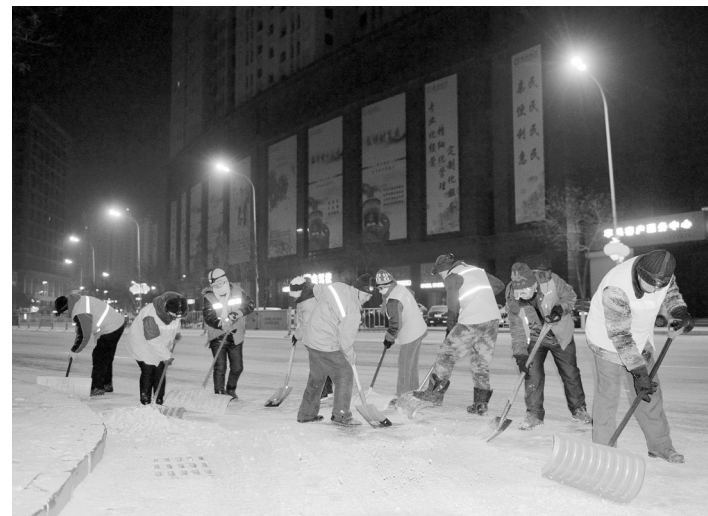
15日清晨,阜新市2000多名环卫工人在市中心进行除雪作业,确保市民和车辆安全出行。