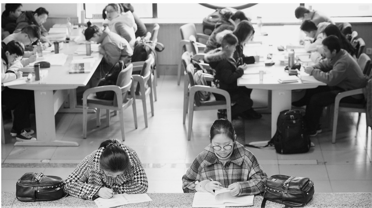
2月15日，两名学生在陕西省图书馆内的走廊边学习。春节假期过后，西安市许多青少年前往陕西省图书馆，在那里开始一天的阅读和学习生活。

为做好节后旅客运输工作，各地铁路部门加大站车服务力度，搞好乘降组织，为旅客出行提供良好环境。哈尔滨局集团公司为贫困地区外出务工人员预留票额，加挂客车车辆，开辟绿色通道；郑州局集团公司加强对列车空调、饮水等设备巡查保养，确保正常运行，提升车厢舒适度，让旅客在寒冬里感受到融融暖意；武汉局集团公司各车站与市政交通部门协调联动，采取延长地铁开行时间、增开夜间公交等措施，打通春运服务“最后一公里”；西安局集团公司安康车务段组织开行务工专列，最大限度满足务工人员出行需求。