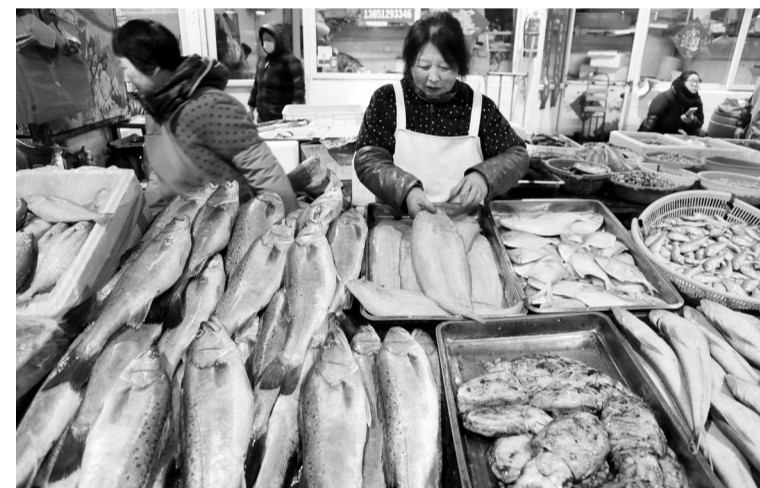
图为在江苏省连云港市一农贸市场，商贩整理待售海产品。

2月15日，国家统计局发布数据，1月份，全国居民消费价格同比上涨1.7%，涨幅比上月回落0.2个百分点，连续两个月处于2%以下。