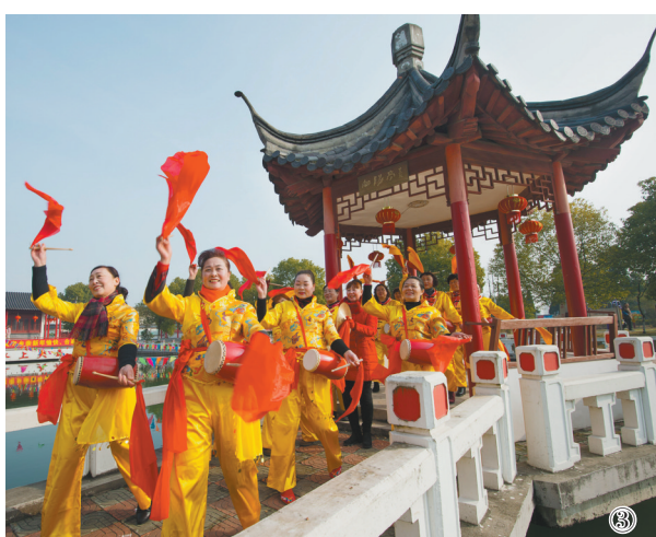
2月5日是农历正月初一,各地开展丰富多彩的民俗活动,热热闹闹闹新春。图①表演者在江苏省淮安市盱眙县表演舞狮。图②在山西省永济市鹳雀楼景区,锣鼓队表演威风锣鼓。图③2月5日,在江苏省海安市曲塘镇刘圩村,当地农民表演腰鼓。