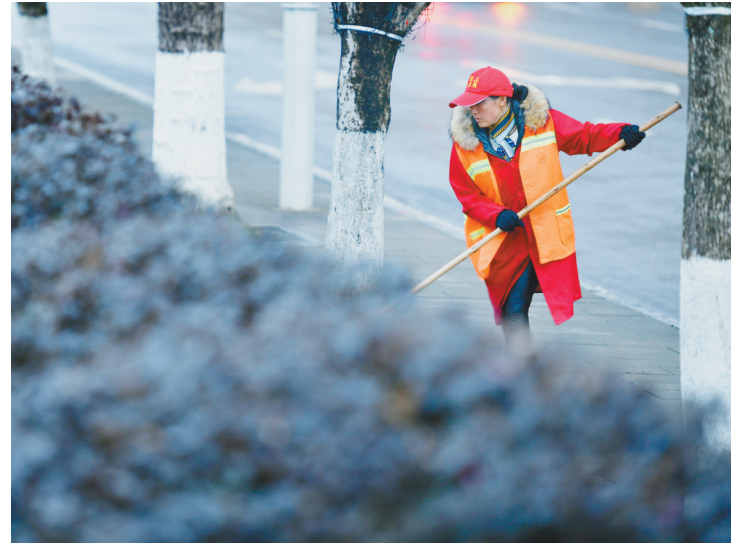
2月4日,环卫工人在湖北恩施土家族苗族自治州宣恩县人民广场清扫保洁。