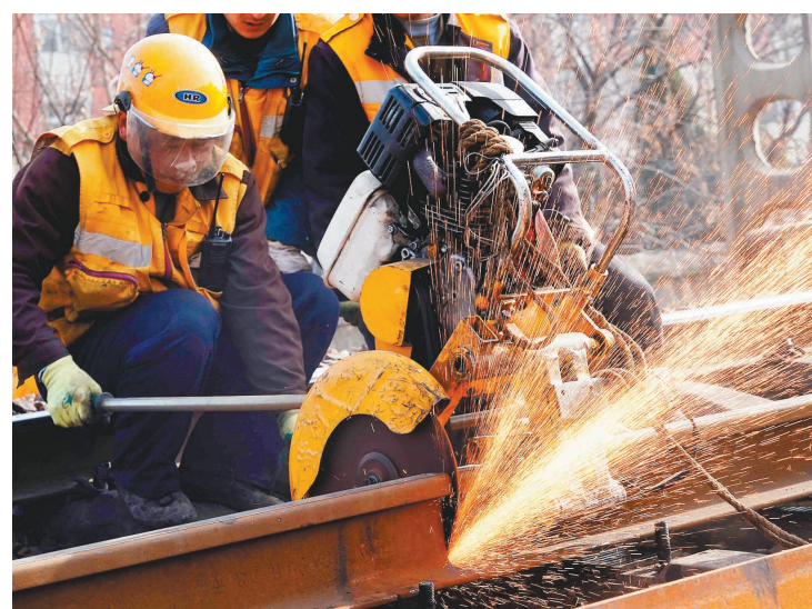
2月5日,中国铁路郑州局集团有限公司郑州桥工段的职工在切割钢轨。当日是农历大年初一,中国铁路郑州局集团有限公司郑州桥工段对陇海铁路郑州站北“咽喉”区一段85米长的钢轨进行更换作业。

春节假期,铁路设备管理部门职工坚守岗位,加强关键设备检查巡视,对有安全隐患的设备及时更换维修,确保列车运行安全通畅。