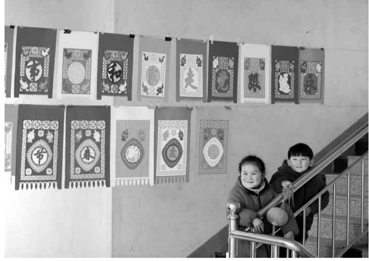
2月4日,在山东省郯城县马头镇万高册村,两名小朋友在晾晒的“五彩门笺”旁玩耍。挂门笺属于民间剪纸,一般用彩纸剪刻而成,是春节期间装饰在门楣上的传统饰物,距今已有1500多年的历史。人们在除夕贴好挂门笺,一门五幅,用意是祝吉纳福,和春联、门画交相辉映,成为春节一道亮丽的风景线。 新华社发