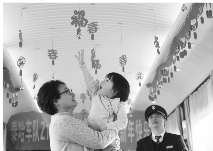
2月4日,在Z157次列车上,一名小朋友伸手触摸车厢内的新春挂饰。当日是除夕,在江苏泰州开往黑龙江哈尔滨的Z157次列车上,列车工作人员精心布置车厢,与旅客一起写“福”字、包饺子。