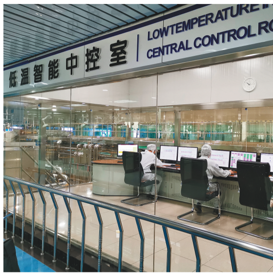
上图 蒙牛乳业(沈阳)有限责任公司低温智能中控室正在监控设备运行。

近一个月来,记者走访农户、农业经营主体、规模企业以及业界专家,他们对发展农产品深加工工业,助推农村一二三产融合,进而促进农村经济发展、农民增收寄予厚望,并积极建言献策——我省农产品加工业发展之路,无论是个体企业还是行业,既要寻求单点突破,更要在突破之后,在优势条件积累的基础上,继续寻求提档升级。