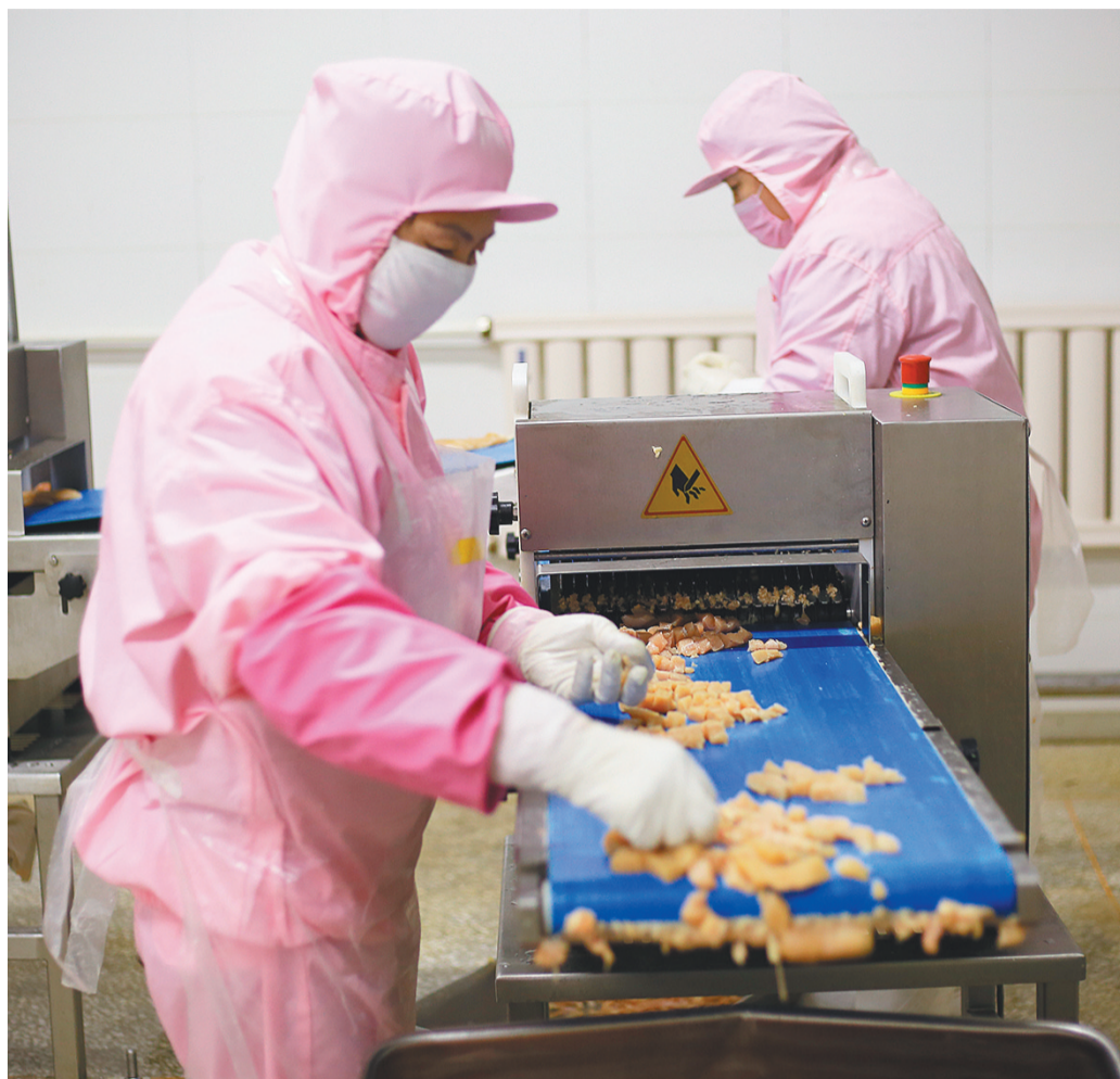
右图 台安农业高新技术产业园内,食品深加工生产线总是很忙。