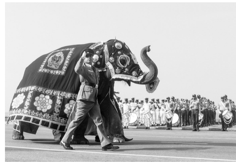
2月4日,斯里兰卡将迎来独立71周年。图为2月2日,在斯里兰卡首都科伦坡,一头小象参加独立日阅兵彩排。