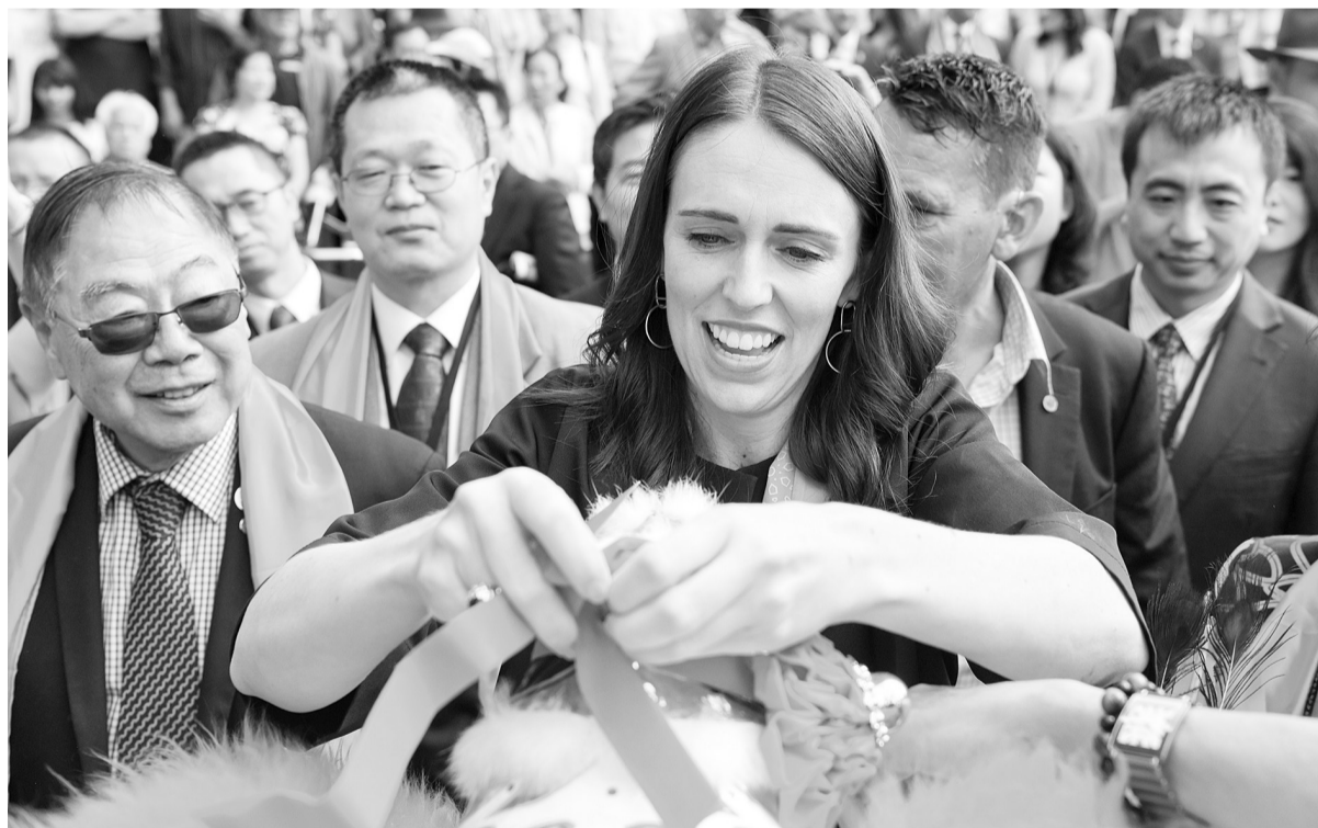
一年一度的“新春花市同乐日”活动2日在新西兰奥克兰举行。新西兰总理阿德恩出席活动,高度肯定华人对新西兰发展所做贡献。图为阿德恩(前)在“新春花市同乐日”活动上为狮子挂上红绸旗。