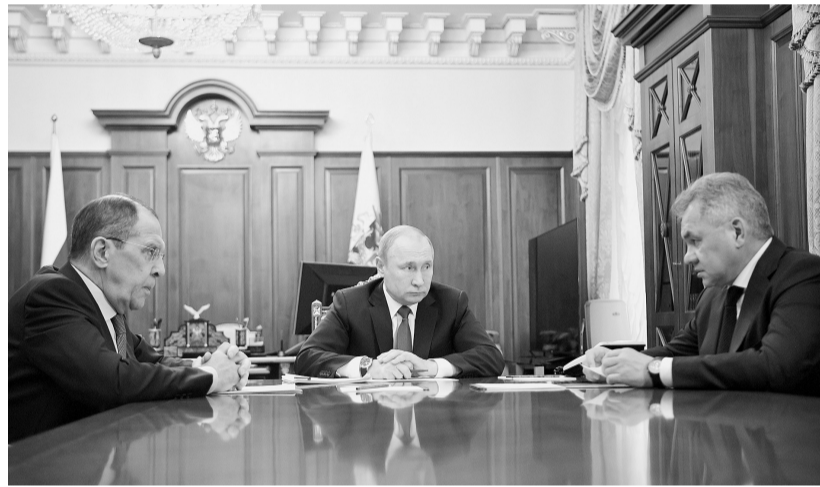
2月2日,普京会晤俄外交部长拉夫罗夫和国防部长绍伊古。