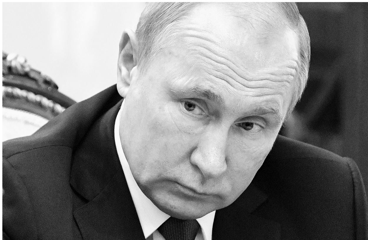
2月2日,在莫斯科,俄罗斯总统普京宣布俄暂停履行《中导条约》义务。

普京表示,鉴于美国的相关做法,俄罗斯已开始研制包括陆基高超音速中程导弹在内的新武器。他说:“他们(美国)宣布他们正在进行(武器的)研制和试验设计工作,我们也将做同样的事情。”