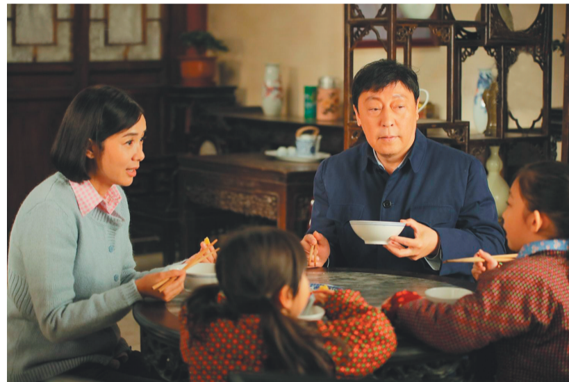
《正阳门下小女人》剧照

样反映改革开放历程的电视剧精品《鸡毛飞上天》《温州一家人》《历史转折中的邓小平》等相比,也有不小的差距。可以说,“改革开放40周年”既是年度国产剧创作的最大主题,同时也是最大考验。一个考验是“还原”,此类电视剧最大的难度可能来自于真实再现这段离我们并不太遥远,因此还记忆深刻的历史,哪怕小小细节上的“穿越”都能被观众识破,让作品立不起来。另一个考验是“提炼”,处理“改革开放40周年”这一宏大叙事,需要对历史有深刻的理解,同时要有极强的故事讲述能力。把人物和情节套入设定命题的公式化处理失之生硬,让人看下去;试图以小见大地尝试又往往往会失之单薄,让人看不到背景丰富的时代图景。