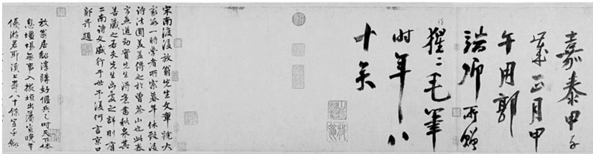
辽宁省博物馆展出的《陆游自书诗卷》，其中提到“猩猩毛笔”一事。