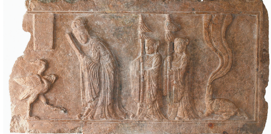
琉璃寺遗址出土的石栏板。

山城位于盖州市青石岭镇。2018年的考古工作主要围绕青石岭山城一号蓄水池塘和四号门址开展。一号蓄水池塘位于金殿山西侧约200米处,经试掘,该蓄水池塘的形状为圆角长方形,长约80米、宽约70米,面积可能超过5600平方米。水池周围存在砌筑规整的石墙,石墙宽约3米至4米,残高1.2米至1.5米,呈台阶状向池内延伸。接近蓄水池塘淤泥层的地层及蓄水池塘的淤泥层中,发现了大量植物的根