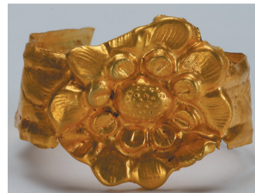
小河北墓地出土器物。

2018年,省文物考古研究院会同中国社会科学院考古研究所、中国人民大学历史学院、辽宁大学历史学院及省内各市县文博单位完成了数十项考古调查、勘探及发掘,沈阳市文物考古研究所完成多项考古发掘。以上这些项目上起新石器时代,下至清末,涵盖城址、建筑址、墓葬、沉船等不同性质遗址,成果丰硕,学术意义重大。