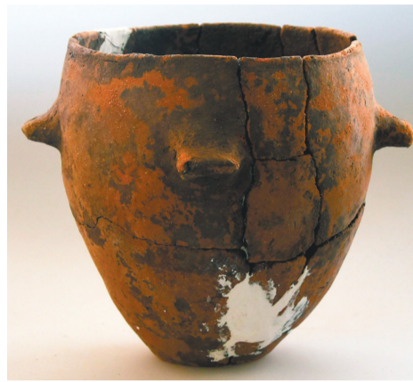
城山遗址出土的陶器。