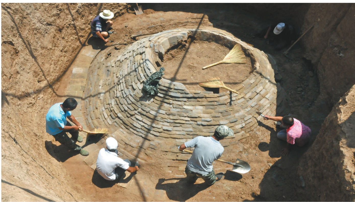
洪家街墓地考古发掘现场。