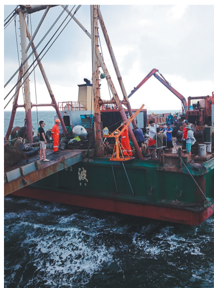
庄河沉船水下考古现场。

沉船遗址位于大连市庄河黑岛老人石南边海域。2014年夏,国家文物局水下考古队依据资料线索与磁力仪物探数据,在该处发现铁质沉船残骸,并推测为经远舰。2018年7月至9月,国家文物局水下文化遗产保护中心、辽宁省文物考古研究院、大连市文物考古研究所联合组队,对该沉船点展开专项调查工作。