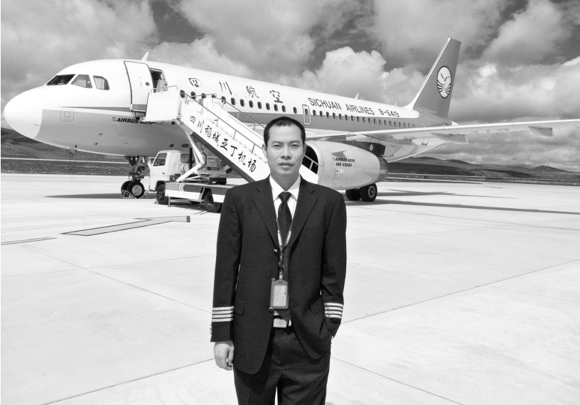
刘传健在高原机场留影(资料照片)。

束昱辉因存在组织、领导传销活动重大犯罪嫌疑，已于2019年1月7日被公安机关采取刑事拘留强制措施。