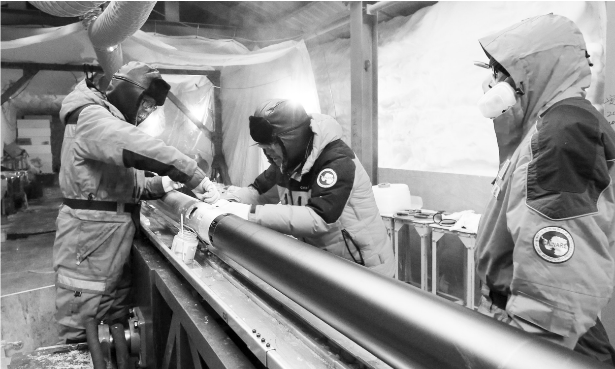
图为科考队员在清理深冰芯钻具(1月12日摄)。