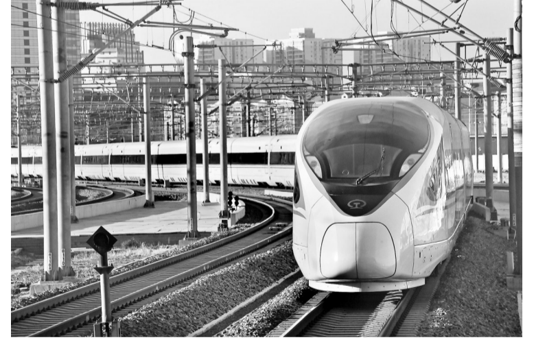
自2019年1月5日零时起，全国铁路将实施新的列车运行图。图为1月4日，一列由北京南开往上海虹桥的列车驶离北京南站。