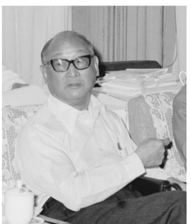
据新华社香港12月29日电(记者 丁梓懿)“宽以济世,诚以育人”,111年前,一位父亲给他刚出生的儿子取名“王宽诚”。

若干年后,他不负父亲期望,赤诚报国,明志兴学,从一名普通学徒成长为支持国家建设和改革开放的香港工商界优秀代表。 1985年,年近八旬的王宽诚倾其财力,拿出1亿美元成立王宽诚教育基金会。这位出生于浙江宁波的老人明确地说,要拿这笔钱资助内地和港澳优秀青年学者出国深造,为国家培养高科技人才。 为国育才他魂牵梦萦了多年的愿望。1978年,内地改革开放激荡着王宽诚的赤子情怀,他以敏锐的眼光看到祖国建设最缺的就是高端科技人才。 截至2017年12月底,基金会在海内外设立的资助和奖励项目达50个,累计7500多人受益。 从实业救国到科教兴国,王宽诚的报国之念由来已久。早在上世纪