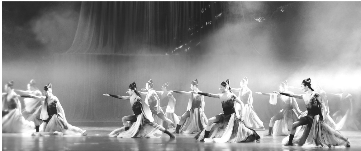
辽宁歌舞团原创舞蹈诗剧《月颂》剧照。

记者从省文化演艺集团(省公共文化服务中心)了解到,为迎接新年的到来,我省四家省直文艺院团——辽宁人民艺术剧院、辽宁歌剧院、辽宁芭蕾舞团、辽宁歌舞团为广大观众准备了精彩的文艺节目。12月24日,四家省直文艺院团排演的十场舞台作品拉开演出序幕。这些作品包括话剧、舞剧、音乐剧,均是经过反复打磨的舞台艺术精品,深受观众喜爱。