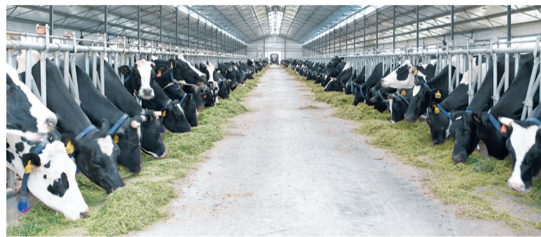
辉山的旗舰牧场登仕堡牧场,占地面积30.7万平方米,可以容纳万头奶牛。

当一种消费品成为每天生活的一部分时,这个消费品就走进人的心灵深处。辉山,是一个直抵人灵魂深处的品牌。