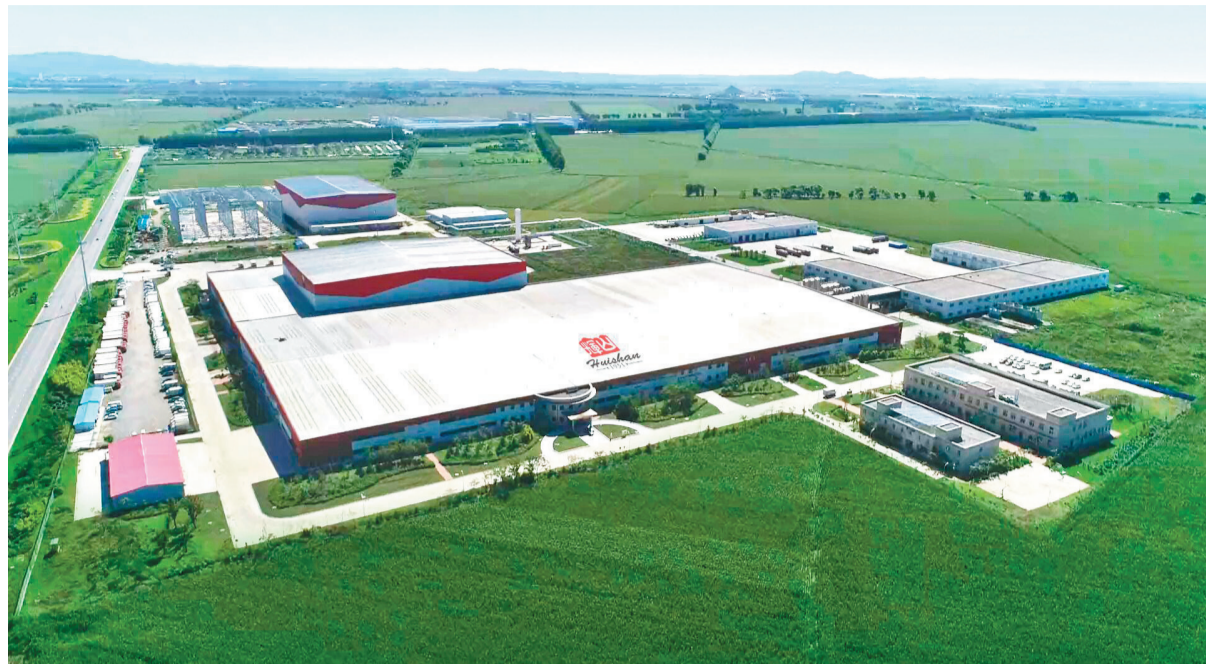
占地面积32.7公顷、总投资13亿元、总建筑面积53万多平方米的辉山液态奶工厂,日产奶量可达1750吨。

辉山,一座通向幸福的桥梁。整吨整吨地批发辉山奶,整箱整箱地销售辉山奶,一个个忠诚客户不断拓展……努力有方向,奋斗有成果,生活有品质。