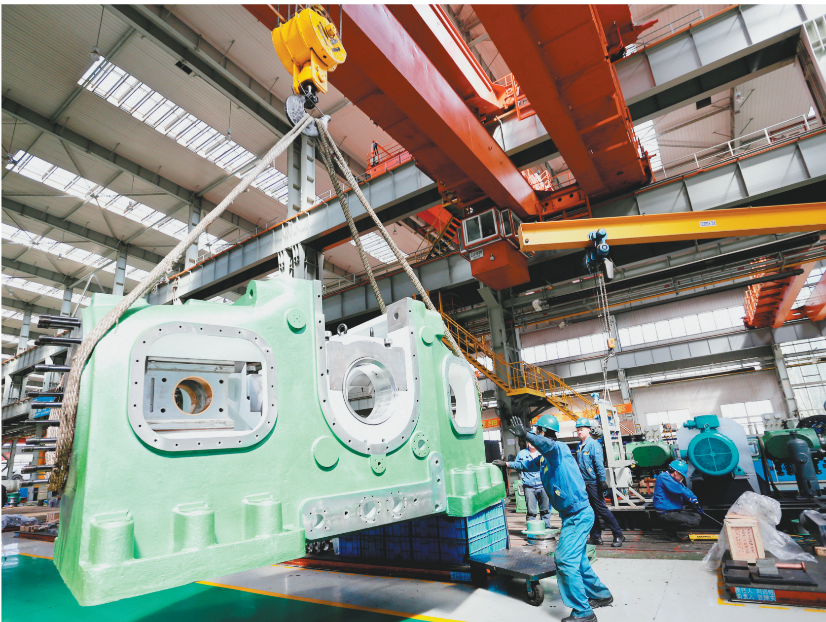
重达20余吨、目前世界上最先进的大推力(1500kN)往复式压缩机4M150机身正在进行吊运。