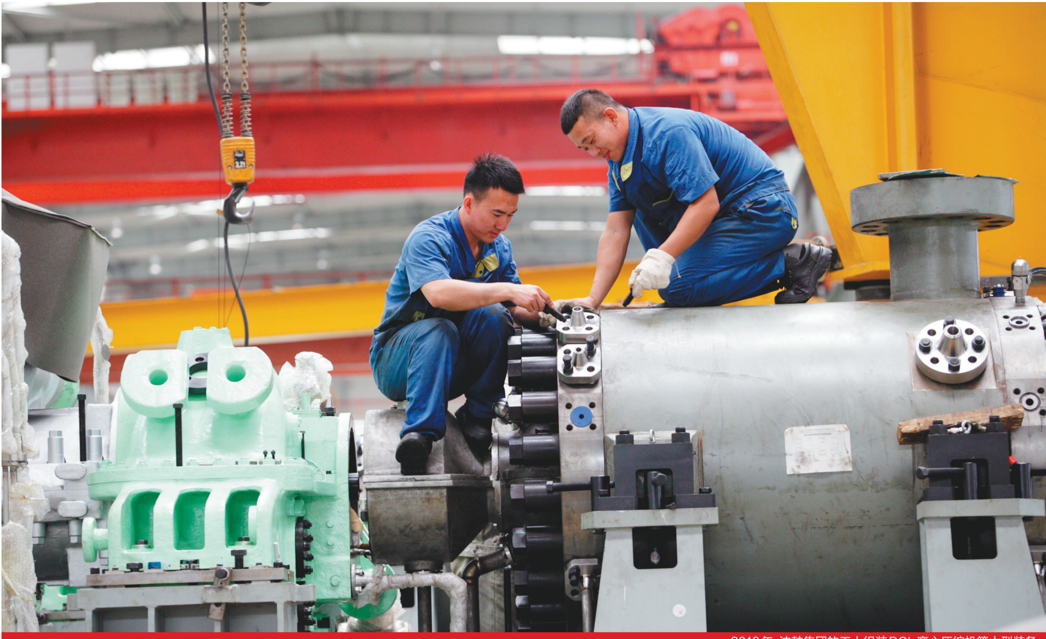
2018年,沈鼓集团的工人组装BCL离心压缩机等大型装备。