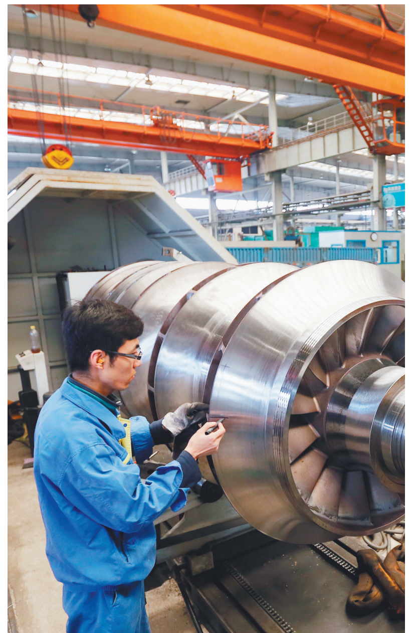
特种钢制的压缩机用转子正在测试中。