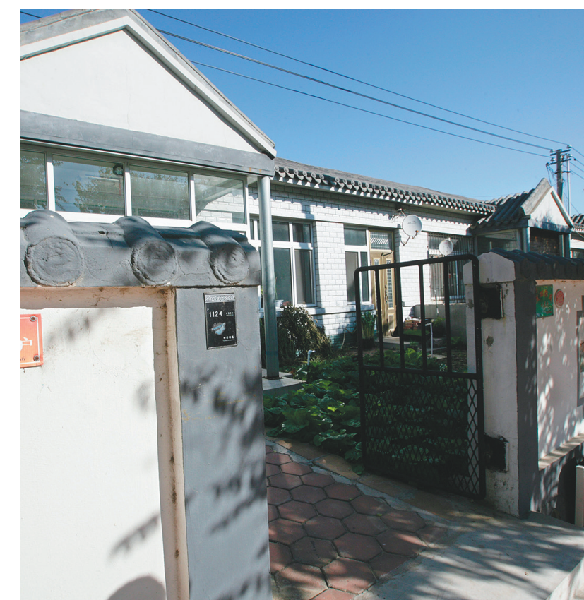
大堡子村家家都有美丽的庭院。