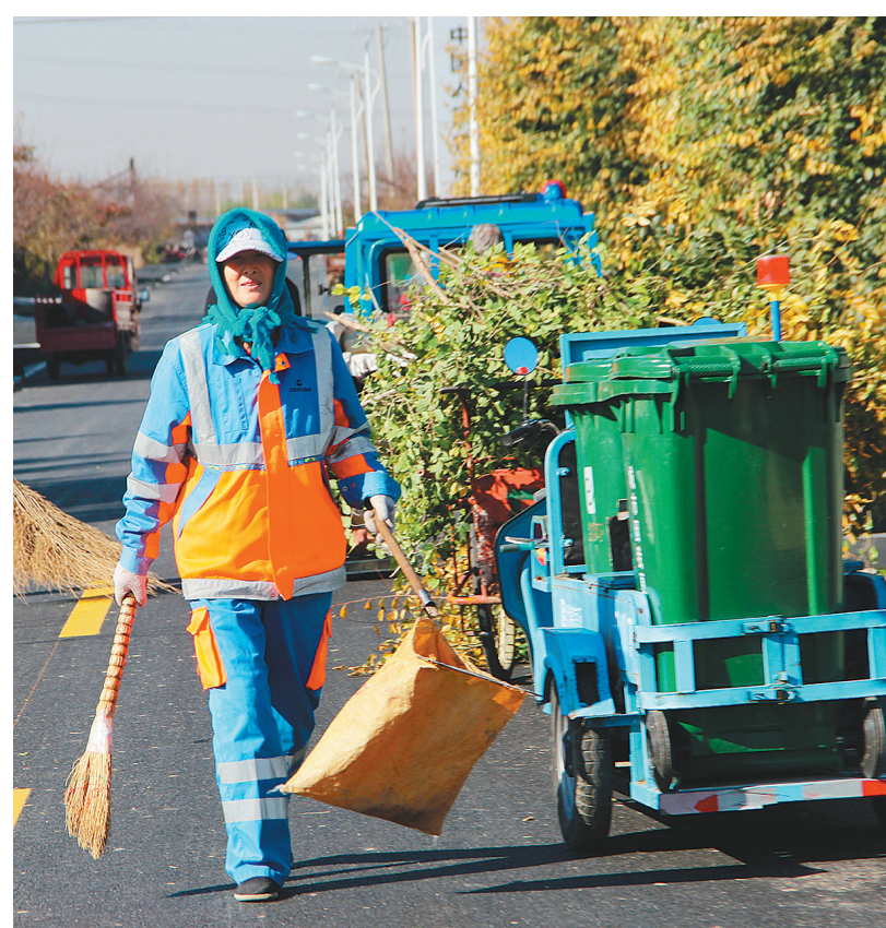
村里的环境卫生采用统一购买服务的方式。