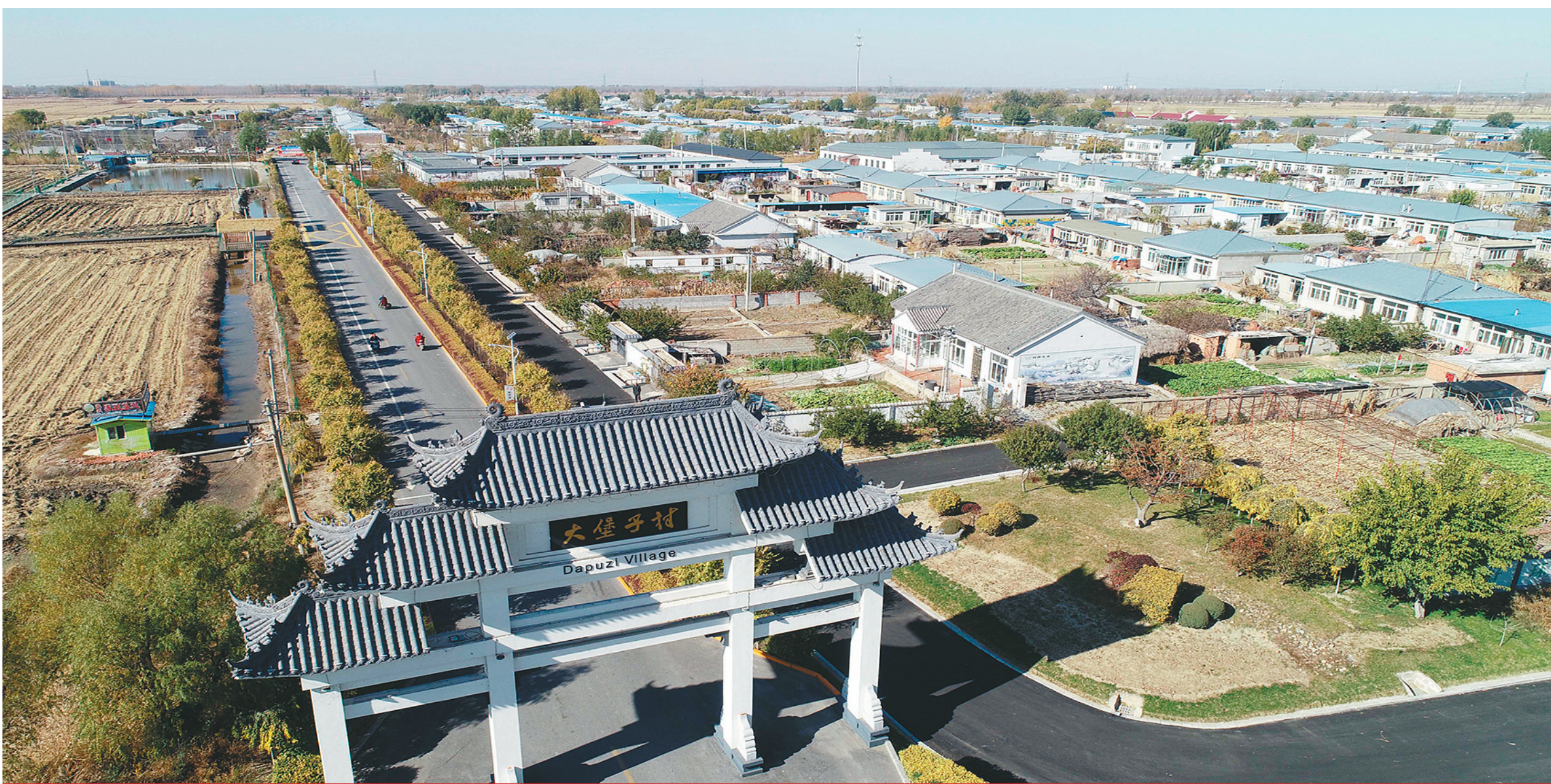
盘锦市大堡子村整齐的街道和民居。