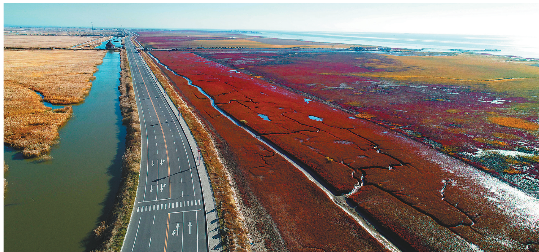
红海滩是盘锦的符号。