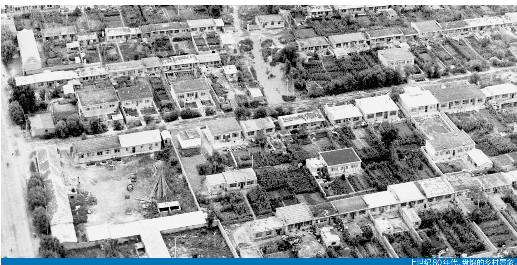
上世纪80年代,盘锦的乡村景象。