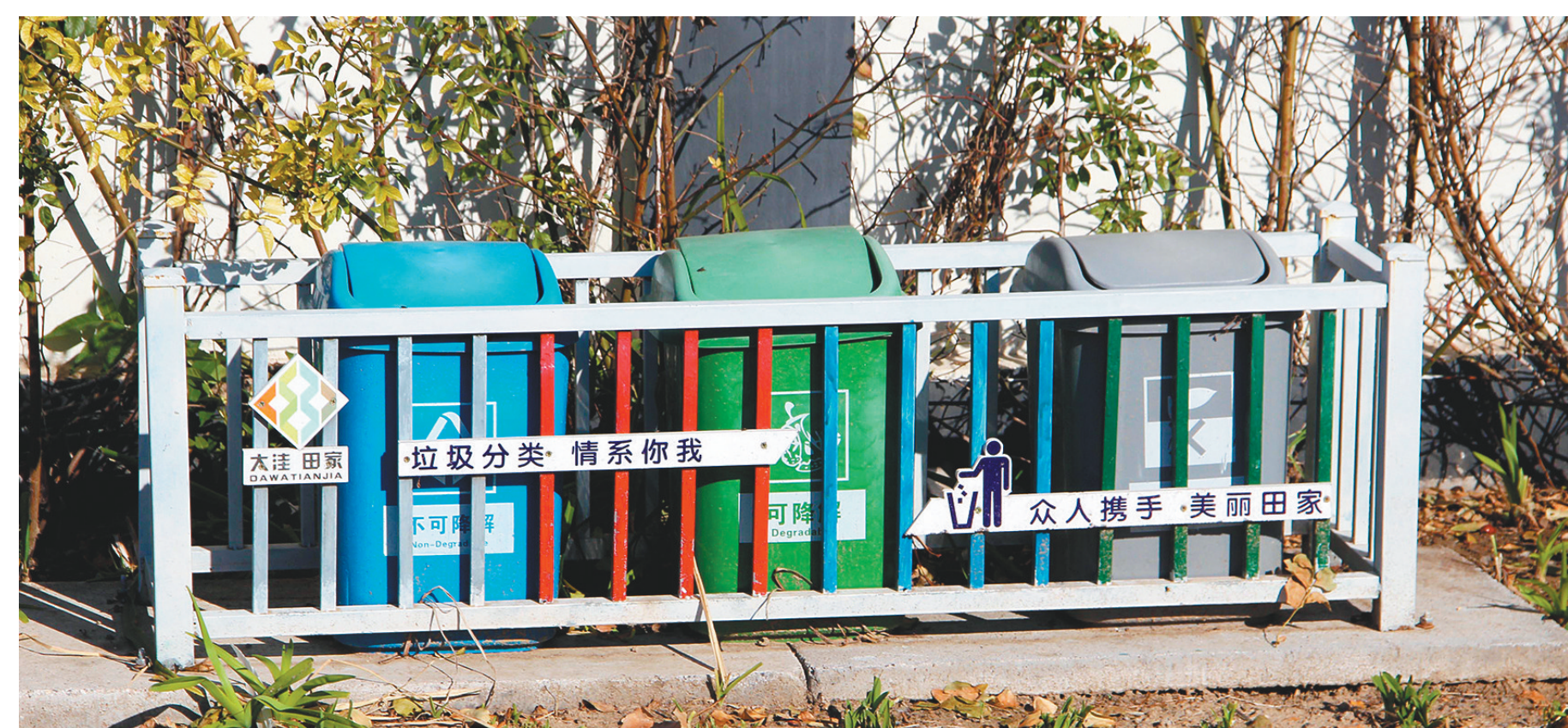
大堡子村实行垃圾分类处理。