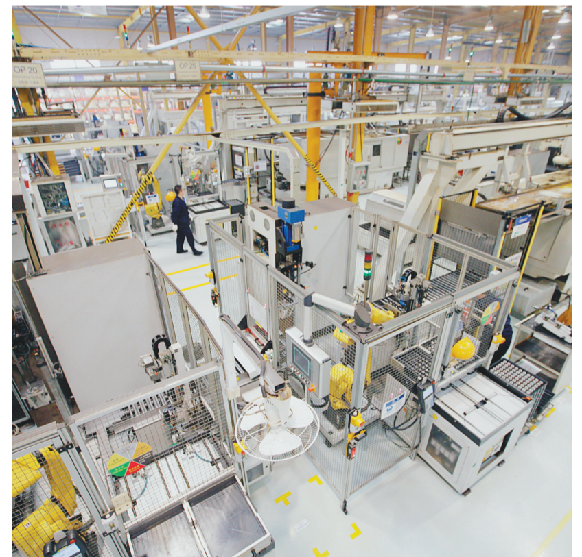
营口自贸区内,(德国)马勒发动机零部件营口有限公司为奔驰、本田等国际汽车品牌配套生产发动机凸轮轴的自动化生产线。