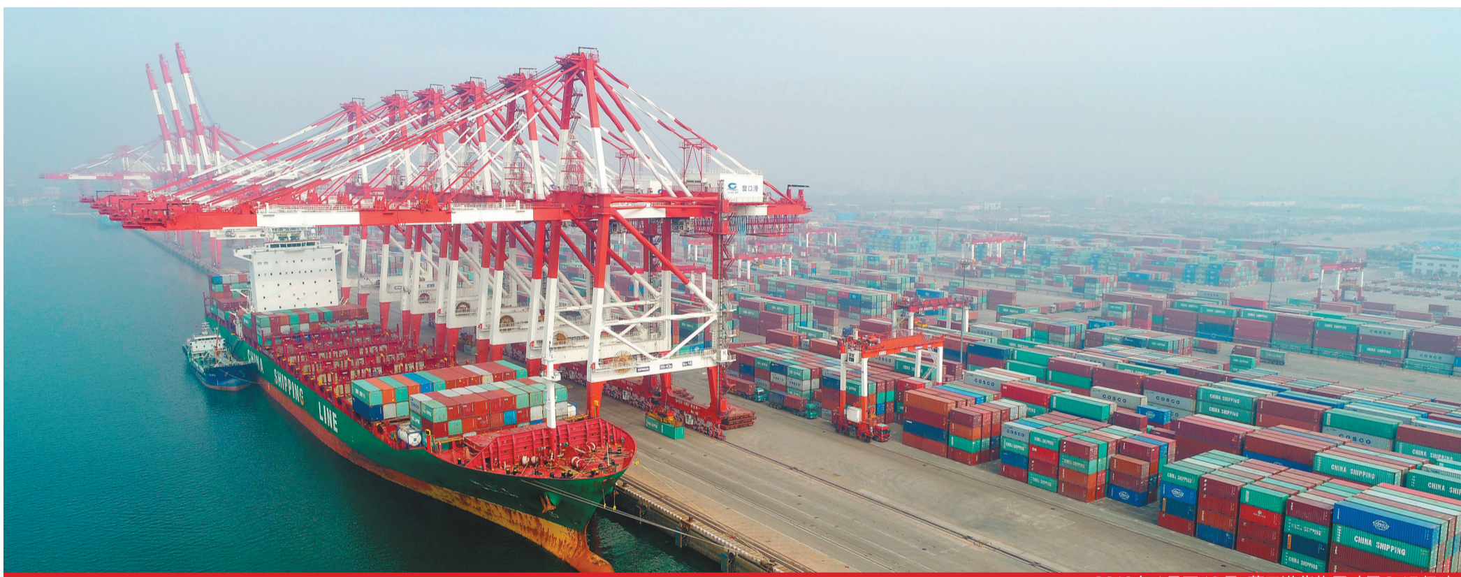
2018年1月至10月,营口港货物吞吐量3.15亿吨。