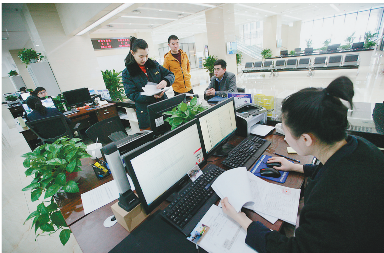
中国(辽宁)自由贸易试验区营口片区办事大厅。