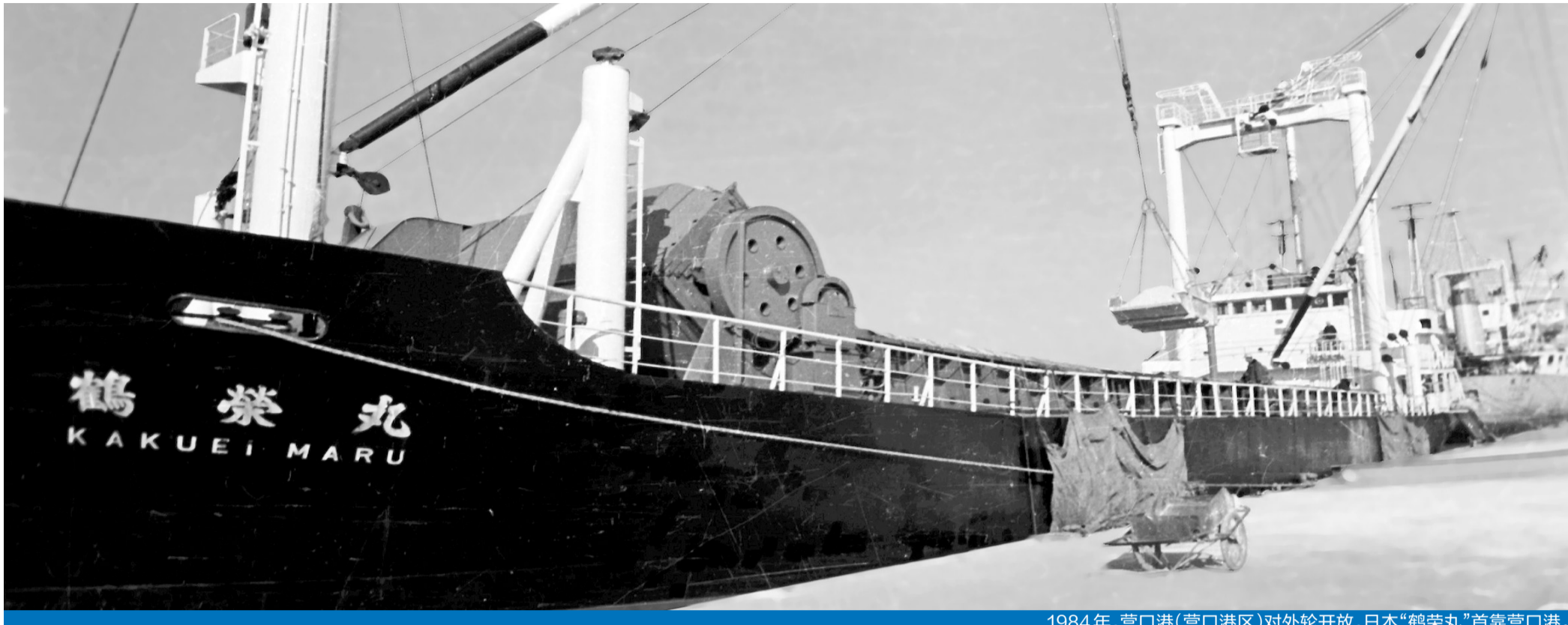
1984年,营口港(营口港区)对外轮开放,日本“鹤荣丸”首靠营口港。