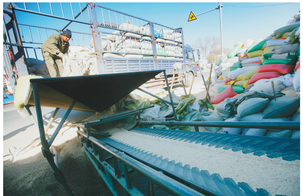
朱碌科镇街道两侧随处可见收购和加工杂粮的网点。