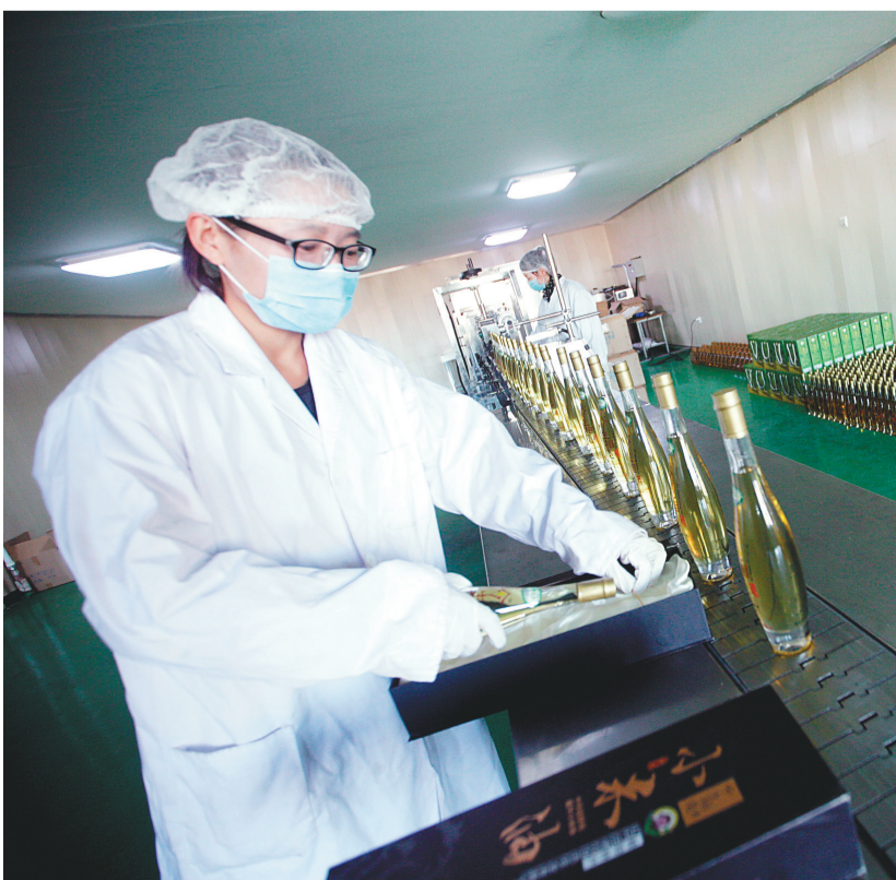
朝阳市建平县建平镇王老汉生态农业有限公司的小米油生产线。