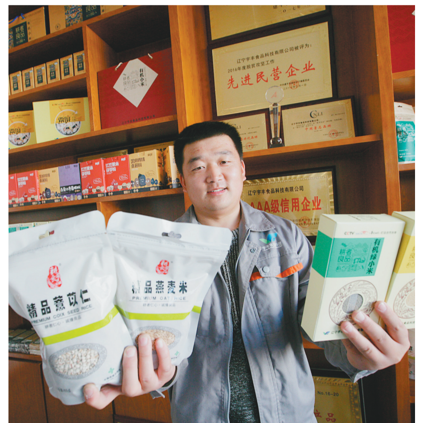
建平县宇丰食品科技有限公司生产的杂粮种类丰富。