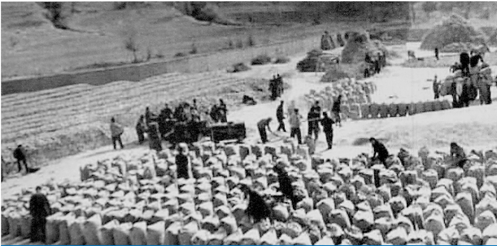
改革开放前,朝阳市建平县老官地公社二队的秋收场面。