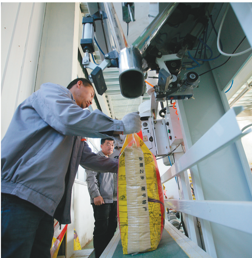
杂粮生产全部经流水线完成。