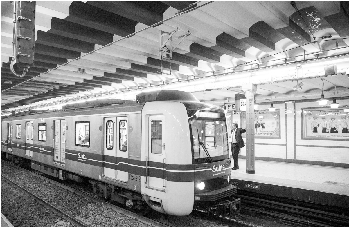
近年来，中国制造的地铁列车在阿根廷轨道网络中投入使用，使当地居民的交通体验更加便捷、舒适。图为 11 月 28 日，在阿根廷布宜诺斯艾利斯地铁 A 线利马站，一名市民等待地铁列车进站。

东萨拉热窝大学哲学学院汉学系主任卜雅娜说，自 2011 年建系以来，已经有 160 名学生进入汉学系攻读本科与硕士学位。汉学系还建立了波黑唯一的汉语水平考试站，先后举办过 5 次大学生中文水平选拔赛和 4 次汉语桥中学生选拔赛。汉学系 2018 年开始招收博士生。