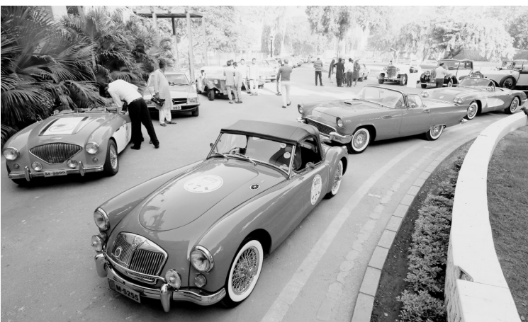
一年一度的巴基斯坦老爷车国内巡游展，于 12 月 1 日在巴基斯坦南部城市卡拉奇开幕。图为在巴基斯坦卡拉奇拍摄的老爷车。