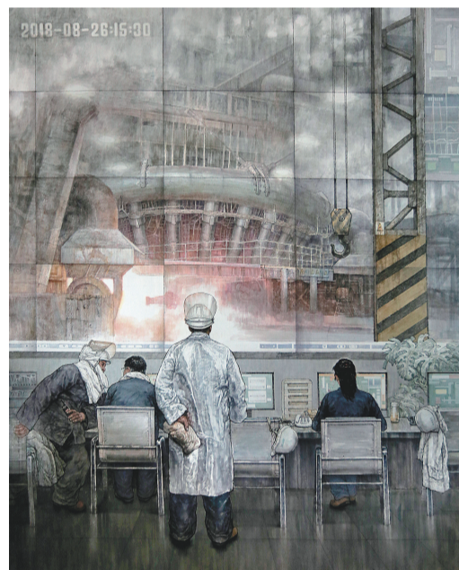
姜海昌《大数据时代》