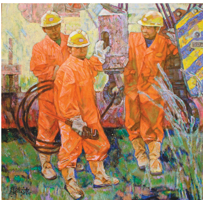
广廷灏《繁忙的大窑湾》