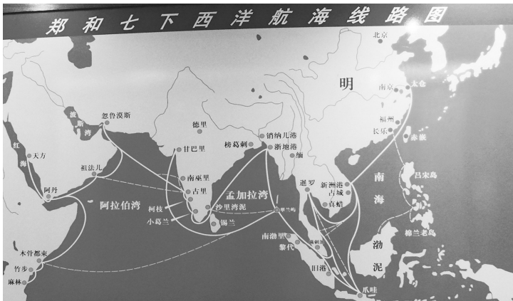
南京郑和纪念馆里展示的郑和下西洋航海线路图。