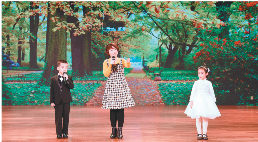
沈阳市大东区图书馆代表队表演诵读《爱与梦想》。

核心提示 经过一个多月选拔,日前,由辽宁省文化演艺集团(省公共文化服务中心)主办,辽宁省图书馆、辽宁省图书馆学会承办的“吟古诵今 献礼祖国——庆祝改革开放四十周年全省公共图书馆诵读大赛”决赛在省图书馆闭幕。本次大赛围绕庆祝改革开放四十周年的主题,歌颂国家、赞美家乡新变化和成就,涌现出许多好的朗诵作品和优秀朗诵者。这表明我省朗诵水平正持续提升。