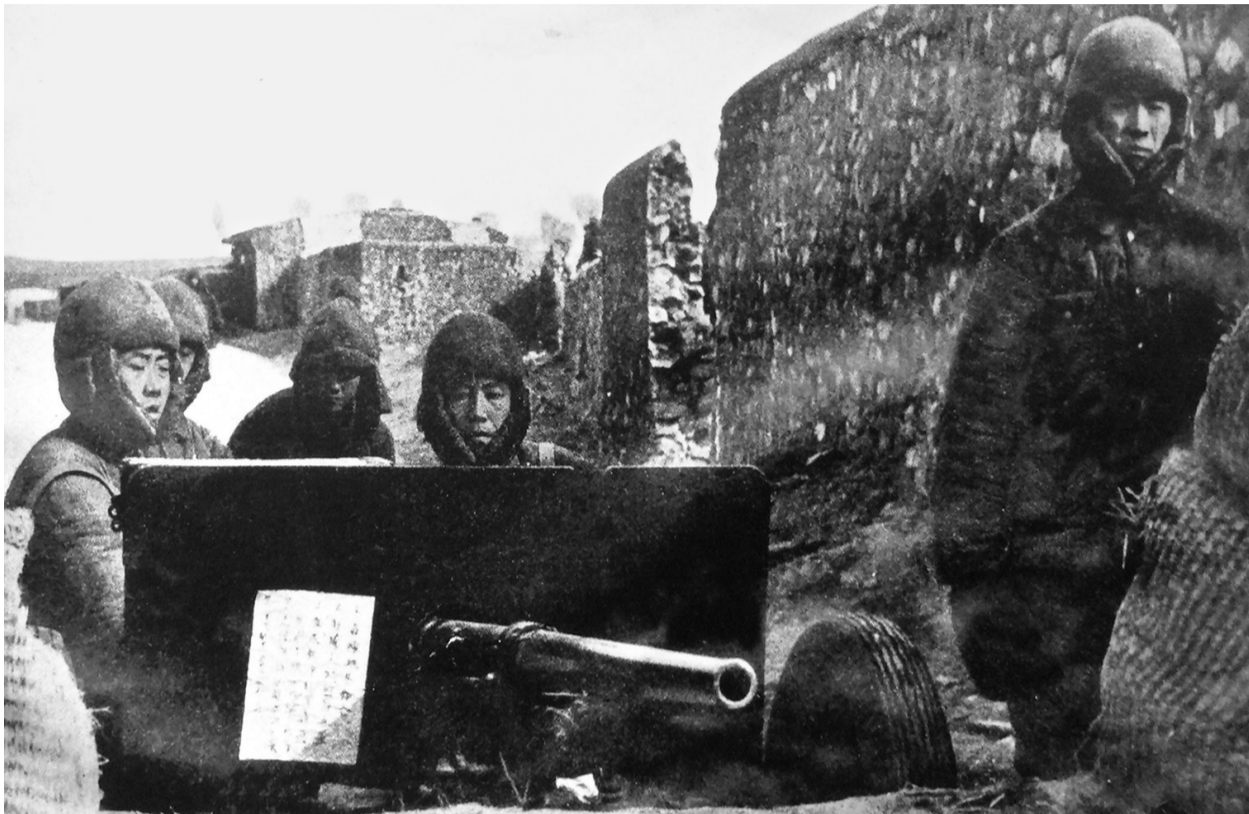
第四纵队的炮兵战士将决心书贴在火炮上,严阵以待。

核心提示 塔山阻击战是辽沈战役中最艰苦卓绝的一仗。经过六昼夜激战,我军打退国民党11个师的疯狂进攻,毙伤敌军7000余人,以机动灵活的战术、惊人的战斗意志,创造了坚守防御战的范例,保证了辽沈战役的伟大胜利。10月15日,在塔山阻击战胜利70周年之际,当年参加战斗的老战士和烈士后代330多人,汇聚于葫芦岛塔山阻击战纪念馆,祭奠英烈,追忆战火纷飞的时代。记者根据参会人员的讲述和回忆录记载,还原了塔山阻击战的4个细节。