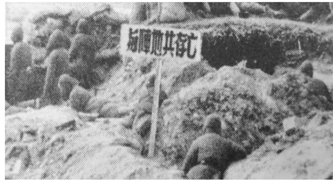
第四纵队将士誓与阵地共存亡。