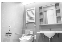
贴心的适老化设计